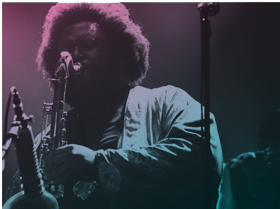
KAMASI WASHINGTON

Eind mei presenteerde het Popdistrict zich in volle glorie (15 verschillende locaties!) middels het Sniester-festival (een samenwerking tussen PAARD en Grote Markt), dat zich bij de keuze van het programma niet richt op grote publiekstrekkers, maar op artiesten die het hart en de spirit van de bezoekers weten te raken en te kietelen. Van heftige gitaarrock, tot diep-persoonlijke singer-songwriters en van beukende ritmes tot wiegende heupen. Op deze editie van Sniester speelden onder meer Millionaire, Intergalactic Lovers en Arp Frique.