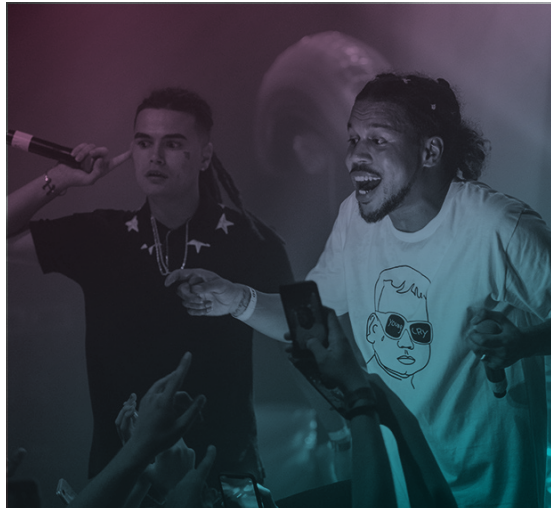
BOKOESAM & JIRI 11

In het kader van kennisdeling is ook de samenwerking aangegaan met Popradar (voormalig Haags Pop Centrum) voor de invulling van de Popradar Academy, een maandelijks masterclass voor jonge upcoming muzikanten met professionals uit de muziekindustrie waarbij kennis wordt gedeeld over onderwerpen als rechten, boekingen, netwerken en fondsen.