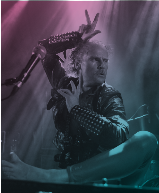
CIRCLE © JAN RIJK

in PAARD te bezoeken. Internationaal is PAARD een kleine speler maar met festivals als Grauzone, Rewire en Mondriaan Jazz wordt wel degelijk een substantieel publiek van buiten de landsgrenzen getrokken. Een goede 7% van de bezoekers kwam van buiten onze landsgrenzen. PAARD ontving in 2018 bezoekers uit maar liefst 64 (!) landen. Onze burens uit België (2%), Duitsland (1,5%) en Verenigd Koninkrijk (1%) kochten hiervan de meeste kaarten. In 2018 liet PAARD een vernieuwd merkonderzoek uitvoeren door Beerda Consultancy. De spontane merkbekendheid bleek meer dan verduubeld, wat een indicator is dat PAARD een positie in de ranglijst van podia met een nationale merkstatus aan het verwerven is.