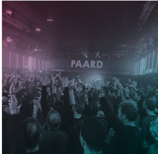
REWIRE 2018

Behalve via business- of vriendenclub kunnen bezoekers ook hun waardering voor Paard laten blijken door een kleine donatie te doen tijdens het aankopen van een kaartje. In 2018 deed 18 % van de kopers een donatie wat bij elkaar € 11.882 opleverde. Dit geld is geheel ten goede gekomen aan akoestische verbeteringen in beide zalen.