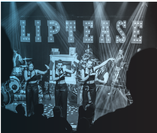
LIPT EASE

Er zijn technische investeringen in het licht gedaan in het