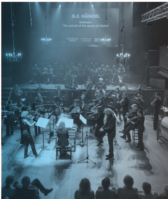
SYMPHONIC JUNCTION © JAN RIJK

In het laatste kwartaal van het jaar ging een wat langer gekoesterde wens in vervulling: optredens op pop up-locaties die niet als concertplek zijn ingericht. De serie Vessel (Eartheater in de Blauwe Kamer en S.T. Cordell in de kelder van The Grey Space in The Middle) werd al na twee edities een begrip in Haagse underground-kringen. De binding met Den Haag blijkt uit de hoeveelheid Haagse acts die in 2016 werden neergezet, namelijk een duizelingwekkend aantal van 869. De positie van Paard-café als kraamkamer van de Haagse scene blijkt alleen al uit het feit dat bijna de helft (425) daar stonden geprogrammeerd.