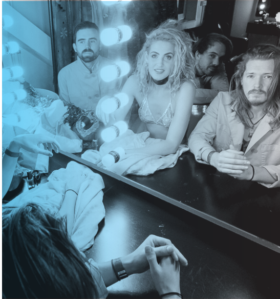
SKIP & DIE

Paard van Troje ontwikkelde als eerste podium de Early Bird-ticket voor concerten en bleef ook in 2016 deze prijsdifferentiatie actief gebruiken om passieve loyaliteit te blijven stimuleren. Paard van Troje is deelnemend