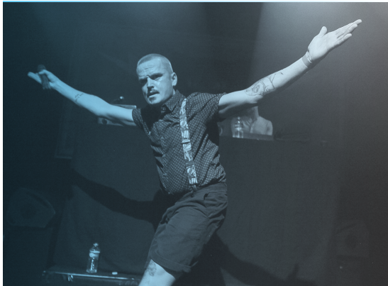
DELIKT @ SNIESTER

De reguliere concertprogrammering liep uiteraard ook door en was in 2016 zeer succesvol. Met 25 uitverkochte concerten in de Grote Zaal (onder andere Echo & The Bunnymen, Seasick Steve, Nathaniel Rateliff en Scott Bradley's Postmodern Jukebox) en 16 in de Kleine Zaal (waaronder Dubioza Kollektiv, Emancipator, Jonna Fraser en Indian Askin) konden we alleen maar zeer tevreden zijn. De zaalbezetting van de activiteiten in het Paard van Troje blijft dan ook onverminderd hoog.