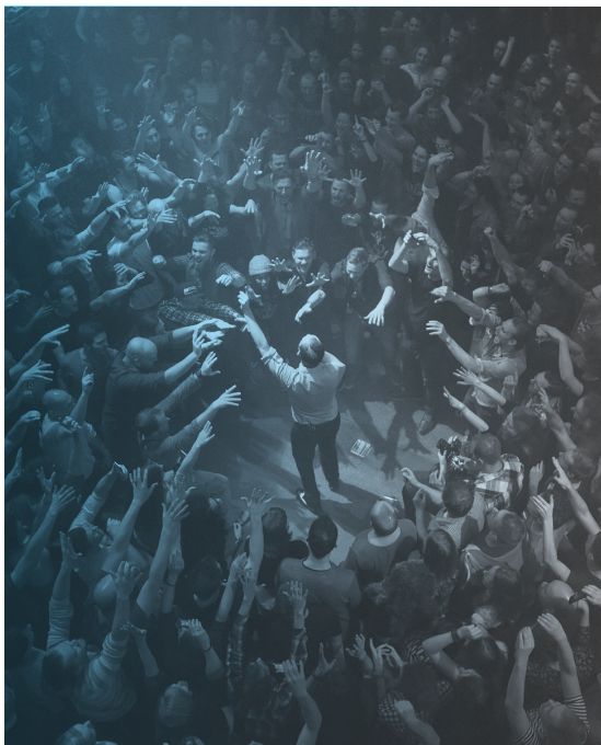
DE STAAT

palet van stijlen binnen de popmuziek en kijkt ook geregeld naar andere muziekgenres als jazz, wereldmuziek, zowel klassieke als actuele gecomponeerde muziek en disciplines als gesproken woord, film en wetenschap. Een poppodium